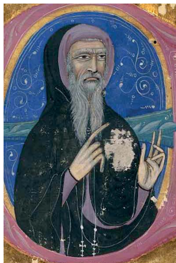
Johan Ferrández d'Heredia

cosechas con consecuencias fáciles de imaginar: hambre y muerte.