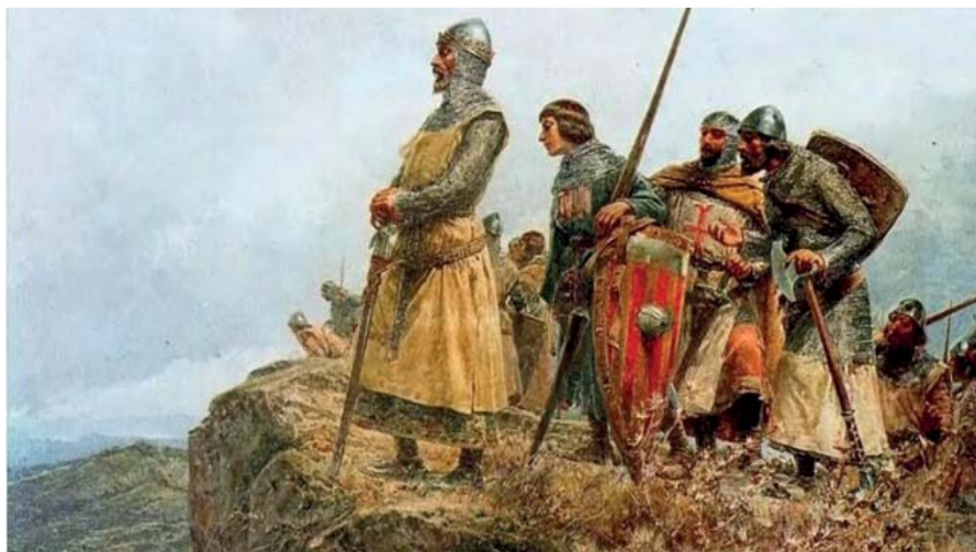
Alfonso El Batallador

Es difícil encontrar exactamente la línea divisoria que mantuvieron las huestes cristianas y sarracenas allá por el siglo XII.