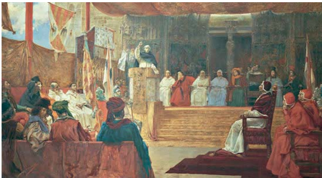
El Compromiso de Caspe