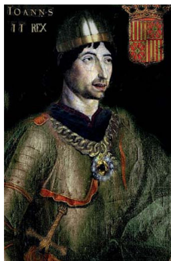
Juan II de Aragón

hoy el edificio, debieron realizarse en esta época, pues así lo atestiguan los dos ventanales geminados de arco semicircular, con dos cabezas muy estropeadas. Una correspondería a Antonio Fluviá y la otra a Salvador Luna. Las cabezas de la fachada de la Iglesia serían también de estos personajes. En el portalluz está gravada la cruz de los Hospitalarios en el centro, el escudo de una de las ramas de la casa Luna aragonesa a la izquierda, y a la derecha el del Gran Maestre de la Orden, Antonio Fluviá. Los mismos símbolos se repiten en la dovela-clave de la puerta de acceso y en dos sillares correspondientes a dos esquinas del edificio. Posteriores devastaciones eliminaron el remate almenado del edificio.