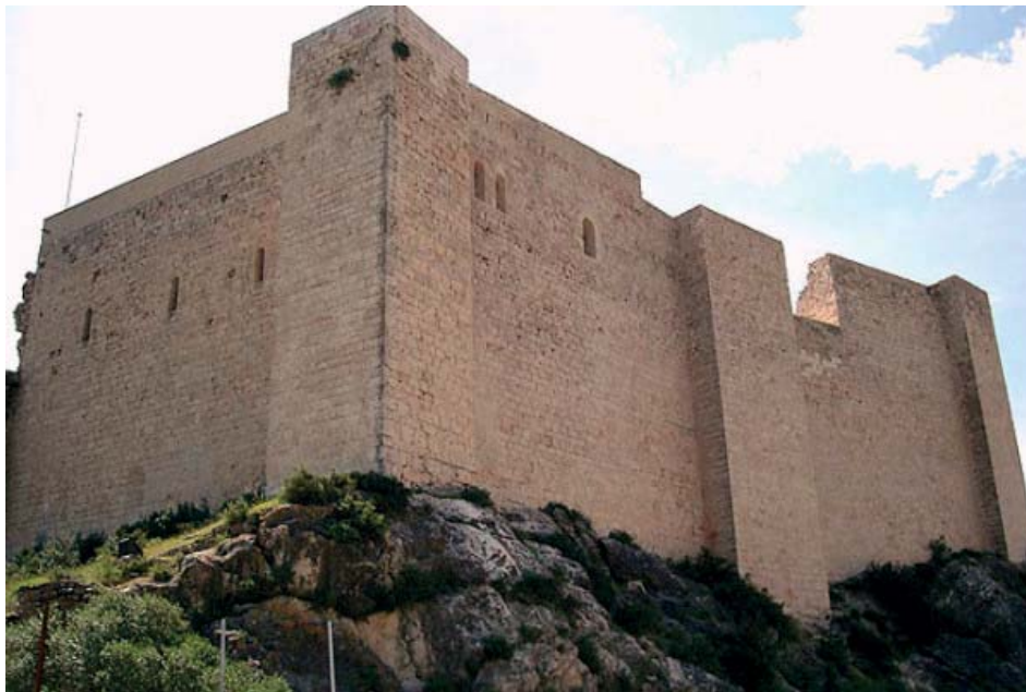
Castillo de Miravet

Los repobladores fueron catalanes de los valles del Pirineo, de la Noguera y del Pallars. Los valles de los Pirineos aragoneses, en cambio, estaban menos poblados y les resultó prácticamente imposible trasladar gente suya del Norte hacia el Sur.