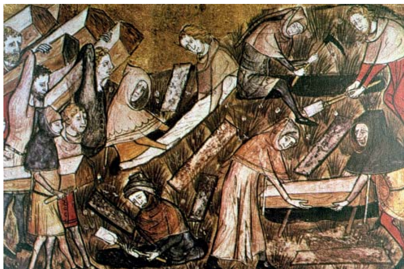
La Peste Negra

En 1358 una nube de langostas destruyó las