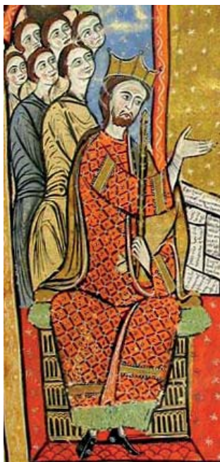
Alfonso II de Aragón