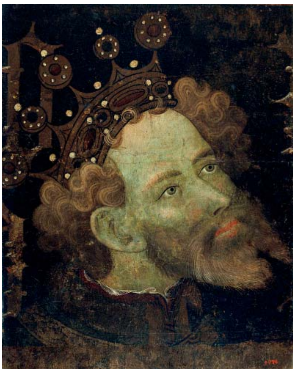
Pedro IV de Aragón

En 1318, con la proclamación de las " Costums de Miravet ", queda establecido el río Algars como línea divisoria entre el derecho aragonés y el catalán. El documento real de Pedro III de 1347 pone en claro la catalanidad de los pueblos y lugares de las comarcas de Miravet y Ascó exceptuando nada más que el pueblo de Nonasp que pertenecía a Aragón porque se