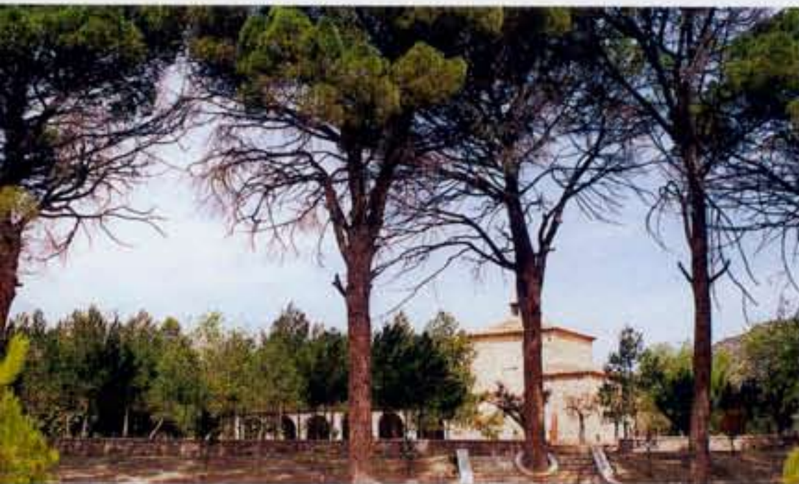
El Santuari des de les pinyeres • El Santuario desde las pinyeras

El lugar donde se encuentra situado este Santuario es hermoso y encantador. Hasta llegar a la ermita, esbeltos cipreses adornan su largo paseo. Sus alrededores ajardinados están cubiertos de frondosos árboles de diversas especies, desde el conocido chopo hasta las seculares pinyeras, y todo ello enmarcado por los dos ríos, Matarranya y Algars, que llenan de frescura y encanto el paisaje. Hay un camping gratuito equipado con todos los servicios.