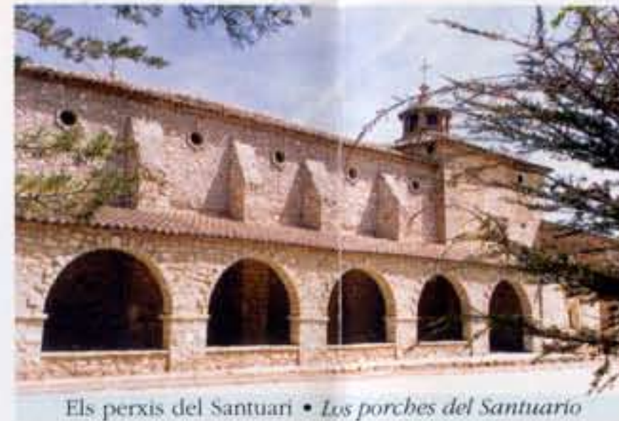
Els perxis del Santuari • Los porches del Santuario

cada día, pues necesitaban de su patrocinio a todas horas. Hecha esta súplica sencilla y devota, se ausentó la Santa Imagen de la cueva y se apareció entre los dos ríos, debajo de la Villa, en la misma punta que forman ambos al unirse. Quedó la Villa muy alegre por haberse dignado la Celestial Señora oír la devota plegaria. Edificóse luego aquí una hermosa Ermita, formando como una punta de diamante contra los dos ríos y quedó aislada entre las aguas de ambos, de quienes tomó el nombre de DOS AGUAS. ”