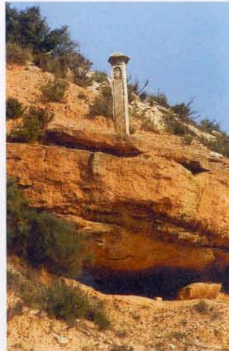
La Cova • La Cueva