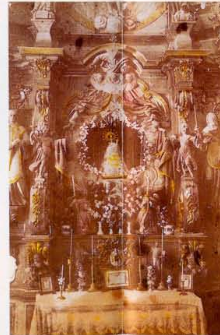
L'antic altar barroc • El antiguo altar barroco