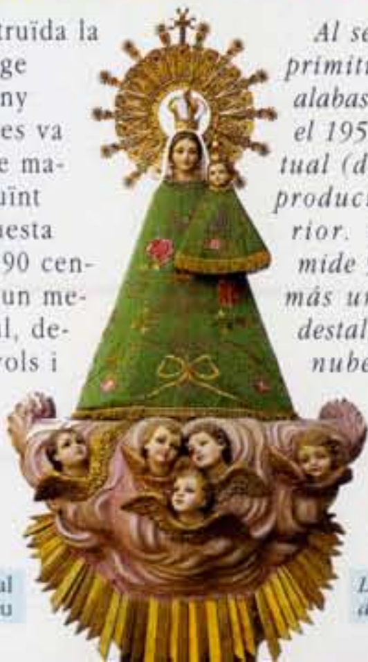
La imatge actual de la Mare de Déu

Al ser destruïda la primitiva imatge d'alabastre l'any 1936, el 1956 es va fer l'actual (de maniquí) reproduint l'anterior. Aquesta imatge medix 90 centímetres, més un metre de pedestal, decorat amb núvols i àngels i raigs dorats. Té el Nen Jesús al costat esquerre.