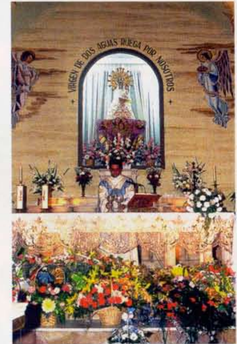
L'altar actual • El altar actual