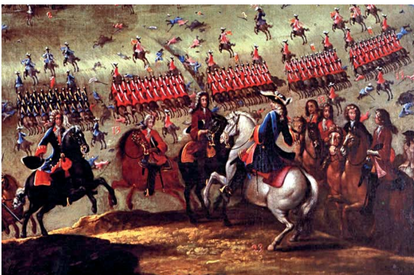
Batalla de Almansa recreada por Ricardo Balaca en 1862

España dividida en dos bandos que dará lugar a una cruel guerra civil, la Guerra de Sucesión (1705-1715). Los aragoneses, en general, tomaron bando por el Archiduque Carlos, perdiendo la guerra tuvieron que aceptar a Felipe V como rey. Puede decirse que con la recuperación del reino de Aragón por Felipe V en mayo de 1707, tras la batalla de Almansa, la guerra de Sucesión había terminado para Aragón a los efectos de las consecuencias político-administrativas. Los Decretos de Nueva Planta de 29-VI-1707, Aragón