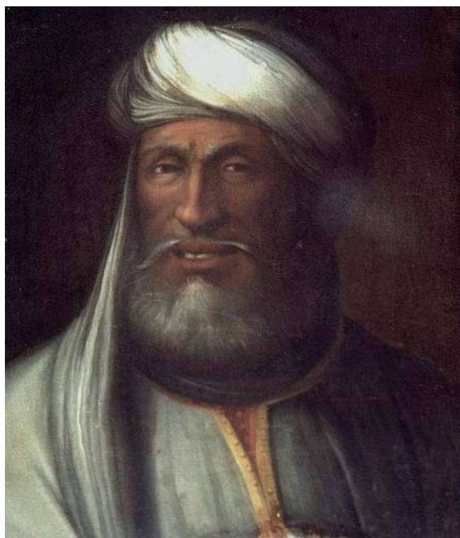
Tariq ibn Ziyad

Els primers àrabs van arribar en els anys 713-714 guiats per Tariq ibn Ziyad. Van entrar pel Sud, ocupant el Baix Ebre, el Montsià, la Terra Alta i la zona del Matarranya i Algars. Uns anys més tard, Musa ibn Nusayr va fer una segona incursió des de Saragossa. S'estableixen les tribus berbers dels hawwara en Fava-