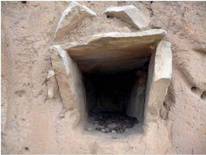
Tombes en Ribers

occidental de l'edifici actual. Es tractava d'un torreó de defensa emmerletat que algun destacament militar musulmà hagués construït per controlar aquesta zona.