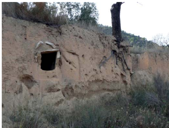
Tombes en Ribers

L'emplaçament del poble de Nonasp venia imposat per diferents exigències: proximitat als cultius, i aprofitar l'elevació del terreny per a la defensa. Aquest afany de seguretat i protecció fer que les cases s'agru-