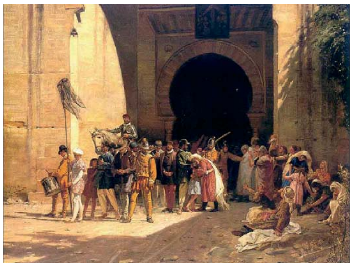
Expulsió dels moriscos per Felip III