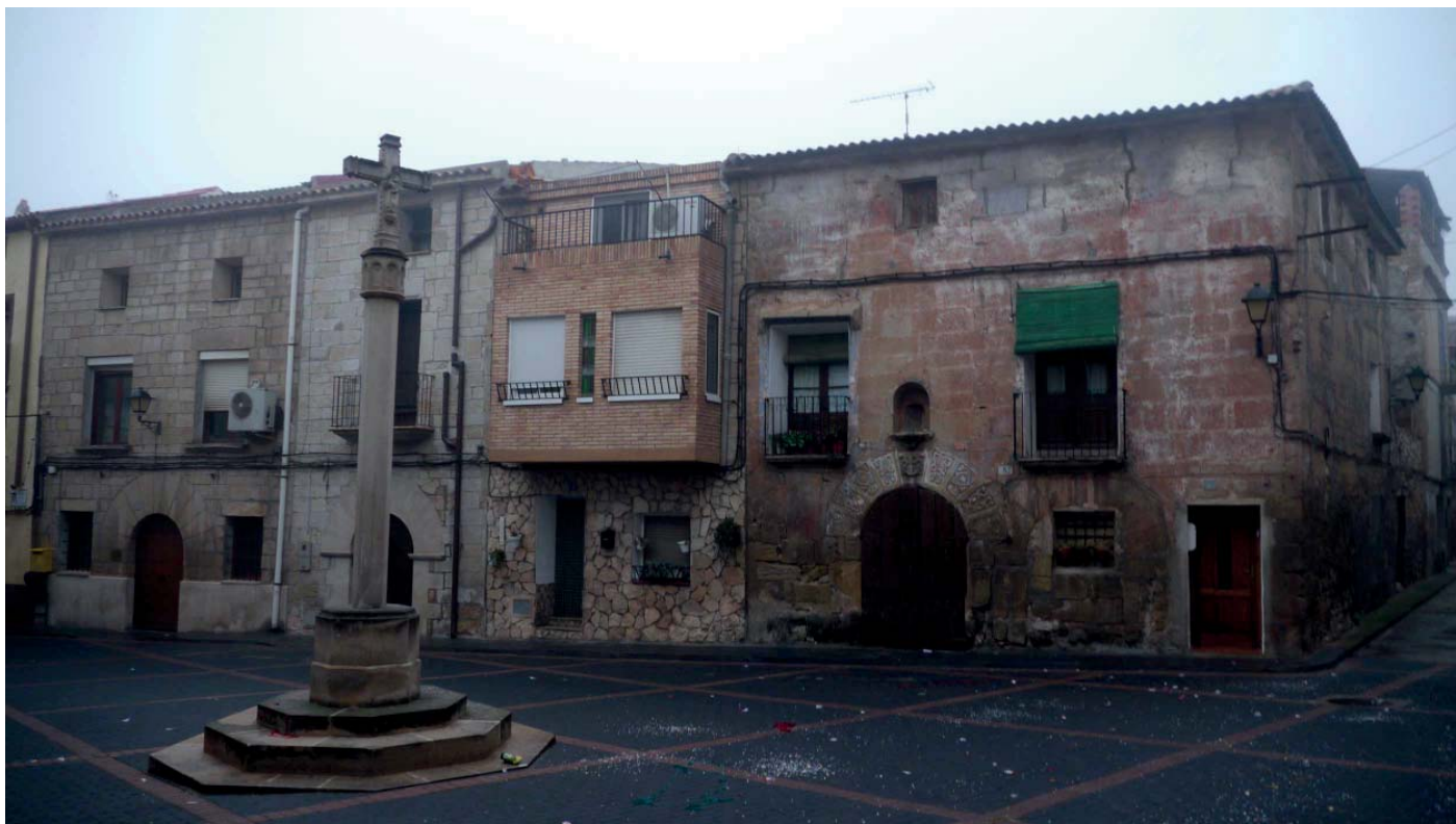
Casa dels “Turlanes Infanzones”

pels dits Infanzones Turlanes predecessors .”