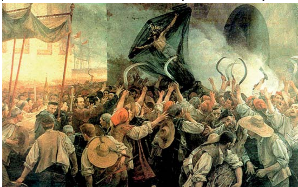
La guerra dels segadors

Cada poble aportava un soldat per cada 12 focs; Nonasp en tenir 55 focs aportaria en un primer moment quatre soldats. L'any 1642, després