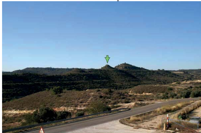
Les Tres Roquetes

Aquest tipus de gravats apareixen en general sobre les cobertes dels megàlits (construcció de tipus funerari), així com també sobre grans roques aïlades. Normalment s'emplaçaven prop de les necròpolis (cementiris). Se suposa que delimitaven llocs sagrats, podent ser un altar de sacrificis. Ocupaven zones altes i prop dels llocs on vivien. Més endavant apareixerà el ferro (segles VIII i VII a. de C.), que juntament amb el bronze s'implantaràn gràcies al comerç de motlles de fosa i lingots. Els assentaments són de dimensions considerables i encara es poden observar restes constructives de cases, amb parets mitgeres comuns, conservant l'arrencada dels murs que formen estructures