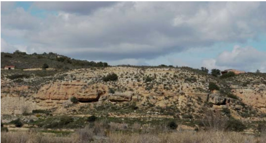
La cova on es va trobar la Mare de Déu de les Dos Aigües, utilitzada com abric prehistòric

Del Neolític Final (començament del tercer mil·lenni) hi ha el jaciment de la Mina Vallfera de Mequinensa, que sembla tenir relacions amb els sepulcres de fossa catalans. En dos cistes de pedra (que recobrien dues fosses prèviament excavades) es van trobar les restes d'un individu en una sepultura i un adult i un nen a un altra. L'aixovar que acompanyava els morts comprenia braçalets, comptes de pedra verda, destrals polides i triangles de sílex.