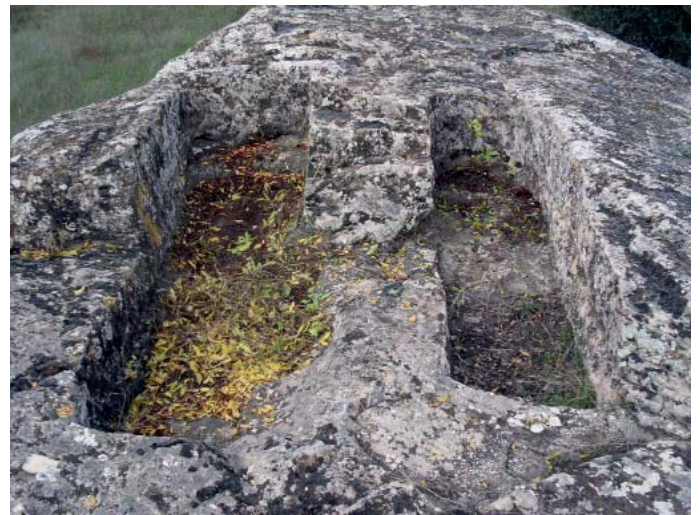
Tombes del Sot de Franquet

Hi ha vida organitzada, relativament rica i culta, en llocs com Fraga (vila rural de Fortunato) i Calceit (necròpolis). Aquests poblats van quedar des-poblats al final de l'època visigoda, amb la invasió dels àrabs que van entrar a la Península Ibèrica l'any 711. Tres anys més tard van arribar a aquestes terres sense trobar resistència i iniciant la població a la muntanya on som avui assentats.