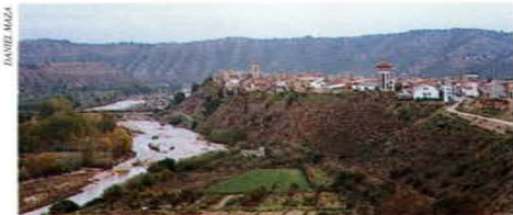
El Matarranya al seu pas per Nonasp