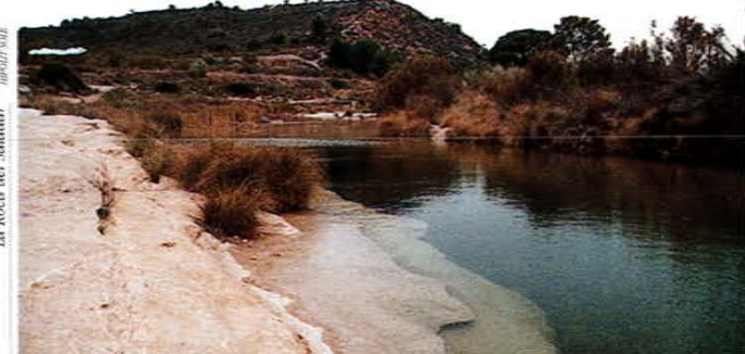
La Roca del Saladar

Los rios Algars y Matarranya están considerados como ejemplos de rios mediterraneos por estar poco afectados por actividades antrópicas. Los dos rios presentan una inusual riqueza biológica que los hace especialmente singulares. En la actualidad, resulta imposible encontrar unos rios mediterraneos en la Península Ibérica con este grado de diversidad.