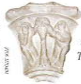
Un capitell de l'església

És un temple d'una sola nau dividida en dos tramades. Té un presbiteri amb capçalera plana. L'església és un típic exemplar gòtic. Ha sofert importants modificacions. L'element més important per la simplicitat i la bellesa de les seues proporcions és la portalada de la façana, les seues pedres presenten els típics senyals de picapedrer que ajuden a datar l'obra vers el segle XIII, probablement en la segona meitat. El campanar és de l'any 1950-51. El temple està dedicat a Sant Portomeu (Bartomeu).