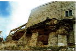
Detall dels fonaments del Castell

Està situat a una terrassa rocosa que forma un penya-segat. Alfons el Cast, l'any 1168, el va reconquerir definitivament als sarraïns. L'any 1248, Elvira de Cervelló, el va cedir a l'Ordre del Temple. El 1317, a l'extinció de l'Ordre, passà als Hospitalers, que l'inclouen a la Castellania d'Amposta. A mitjan segle XIV, el mestre