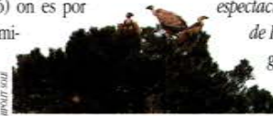
Grup de voltors

Els rius Algars i Matarranya són considerats com exemples de rius mediterranis per estar poc afectats per activitats antròpiques. Els dos rius presenten una inusual riquesa biològica que els fa especialment singulars. En l'actualitat, resulta impossible trobar uns rius mediterranis a la Península Ibèrica amb aquest grau de diversitat.