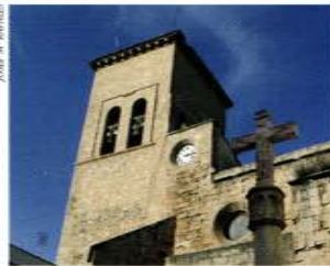
Església de St. Portomeu