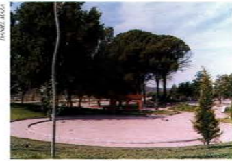
Pinyeres al parc de l'Ermita

També es pot practicar senderisme, tant en bicicleta com a peu, pels diferents camins del terme. D'aquesta manera es poden conèixer llocs tan atractius com la Roca del Saladar (toll d'aigua al riu d'Algars); interessants com els gravats prehistòrics a les Tres Roquetes, els poblats ibèrics del Pontet i de la Vall de Batea o les sepultures visigòtiques als Vilars; insòlits com la important colònia de voltors a Ribers (al cap del riu Matarranya); i espectaculars com lo Castellet de Faió (per l'antic camí a Faió) on es pot veure una panoràmica impressionant de tota la vila.