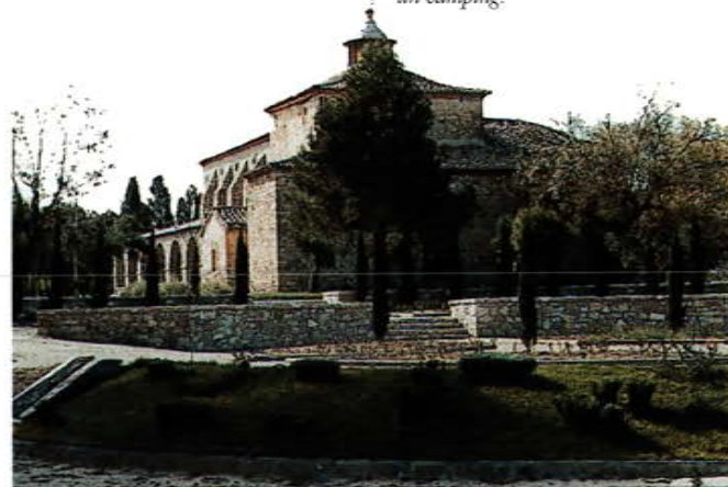
Vista de l'Ermita i el seu parc

A levante de la villa, en la confluencia de los dos rios, está el santuario de la "Mare de Déu de les Dos Aigües". Obra del s. XVIII, con cruz latina, cubierta con bóveda de lunetas. En los años 1986-87, se añadió un porche en torno de la nave que hace las funciones de contrafuerte. En los alrededores de la ermita hay un parque con unas pinyeras centenarias y un camping.