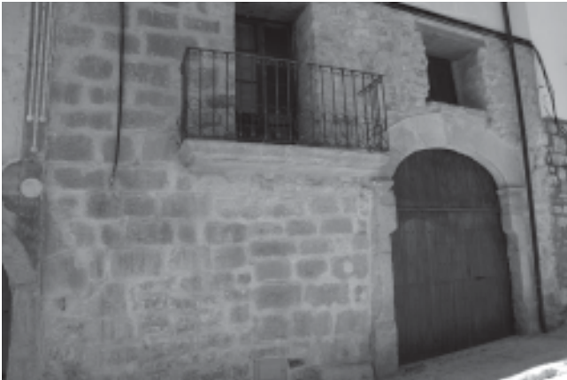
Maig de 2008