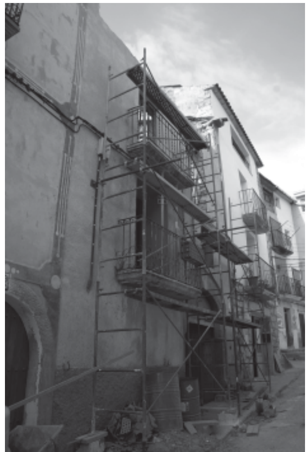
Agost de 2007