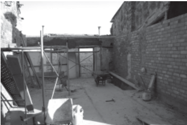
Juliol de 2007