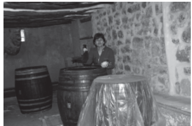
Novembre de 2008