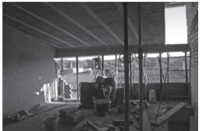
Novembre de 2007