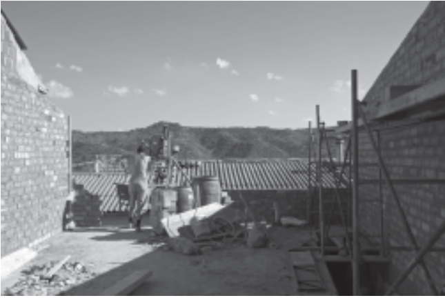
Setembre de 2007